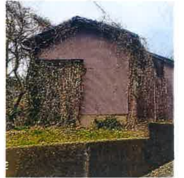
※現状渡しになります。